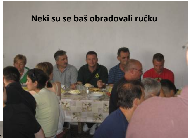
Neki su se baš obradovali ručku