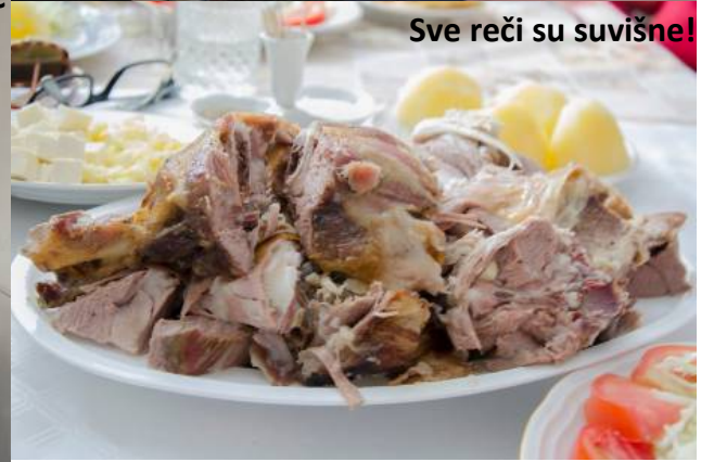
Sve reči su suviše!